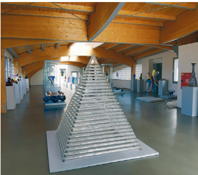
In der Ausstellung des Novotný Glass Museums