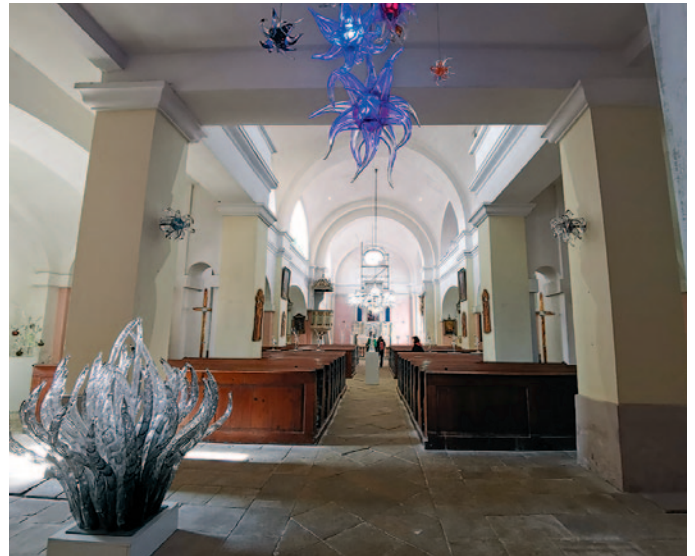
Kirche des Heiligen Kreuzes mit Glasobjekten

Neben dem Glasgarten ist auch eine traditionelle Glashütte, eine Schleiferei, eine Glasverkaufsgalerie und der sogenannte Glasstempel. Der Glasstempel ist die direkt neben der Glashütte stehende Kirche des Heiligen Kreuzes, die mit Glasobjekten, wie Lampen und Installationen von Pačinek Glass ausgestattet ist.