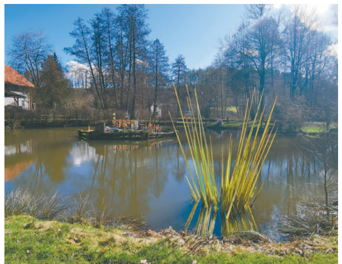
Teich neben der Glashütten-Schenke

Ein weiteres Highlight im sogenannten Kristalltal ist die Glashütte AJETO mit der Glaswerk-Schenke in Lindava (Lindenau). Die Glashütte, in der man den Glasbläsern bei ihrer Arbeit zuschauen kann, ist aber nur von April bis September geöffnet. Dafür kann man aber in der Schenke ganzjährig einkehren und es lohnt sich, hierher zu gehen. Von der Terrasse der Schenke hat man einen guten Blick auf die kleine Insel mit Glasobjekten, die sich in der Mitte des angrenzenden Teiches befindet.