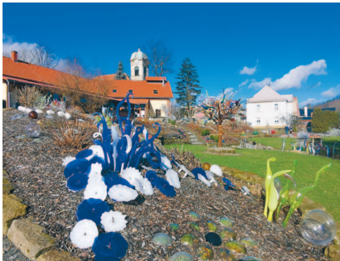
Glasgarten von Pačinek Glass

Gerade jetzt in der vegetationsarmen Zeit ist die Besichtigung des wundervollen Glasgartens von Pačinek Glass in Kunratice u Cvikova (Kunnersdorf bei Zwickau) sehr zu empfehlen.