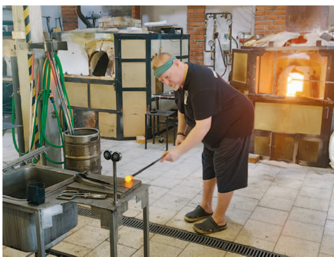
In der Schauwerkstatt von Pačinek Glass

Neben dem Glasgarten ist auch eine traditionelle Glashütte, eine Schleiferei, eine Glasverkaufsgalerie und der sogenannte Glasstempel. Der Glasstempel ist die direkt neben der Glashütte stehende Kirche des Heiligen Kreuzes, die mit Glasobjekten, wie Lampen und Installationen von Pačinek Glass ausgestattet ist.