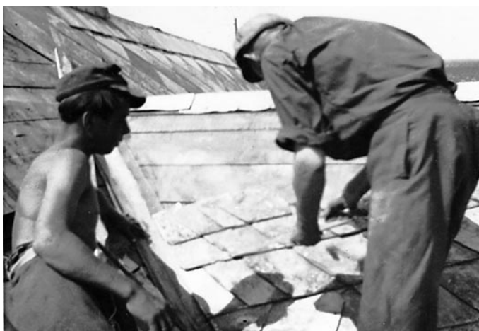
Vater mit Lehrling bei einer Schieferdeckung

Sein Betrieb hatte in der Regel immer einen Lehrling und mehrere Hilfskräfte bzw. auch später Facharbeiter.