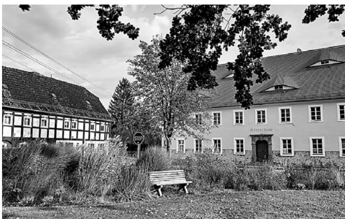
Das ehemalige »Klängel-Gasthaus« und der »Kretscham«

Die Präsentation der Ergebnisse findet dabei standesgemäß in einem tschechischen Restaurant, in Polevsko, statt. Und sie haben die Möglichkeit, mit einem Bustransfer (kostenlos) zum Ort der Präsentation hin- und hergebracht zu werden.