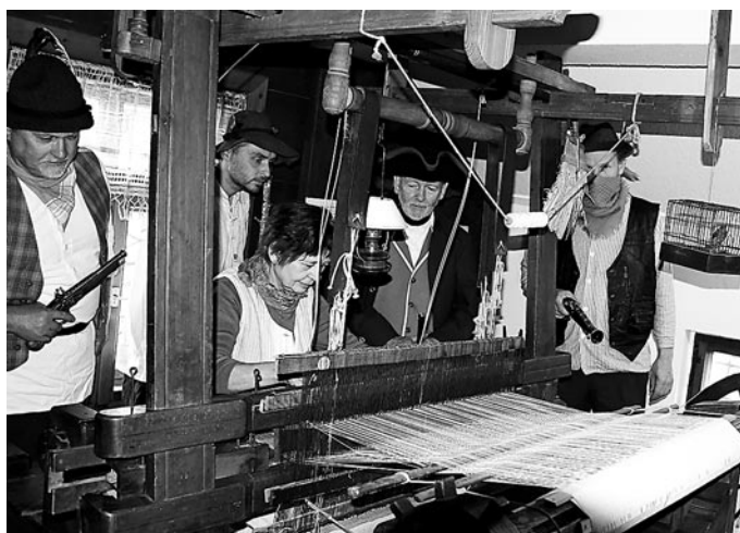
Schauvorführung am Webstuhl