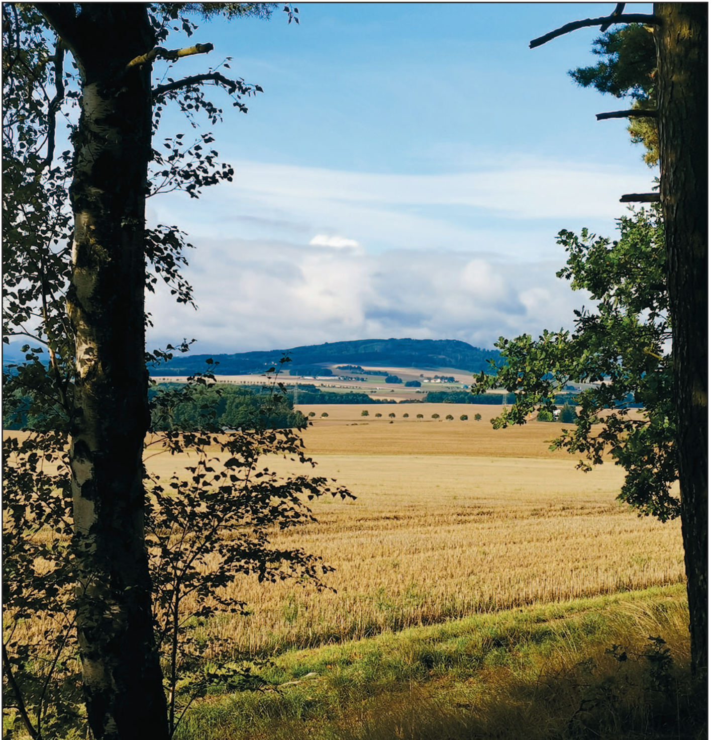
Der Kottmar – mit Blick vom Waldrand auf dem Weg zum Hölzel/Wolfsberg

Amtsblatt der Stadt Herrnhut für Berthelsdorf, Großhennersdorf, Herrnhut, Rennersdorf, Ruppersdorf und Strahwalde