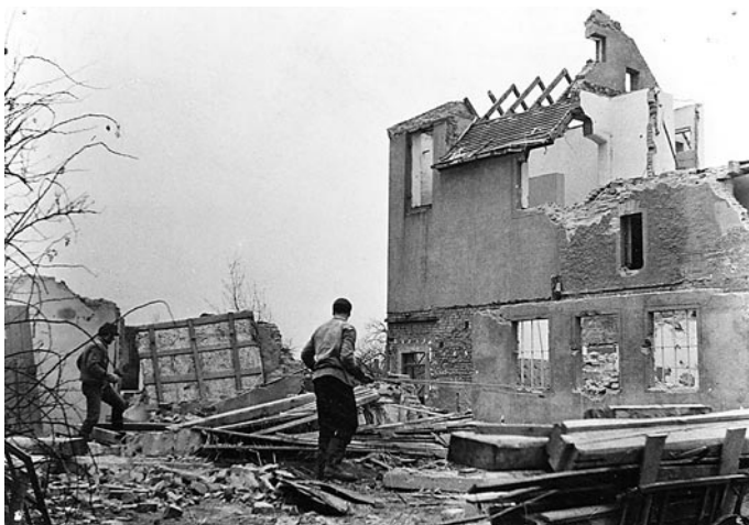
Abrissarbeiten Wohnhaus Hertzsch, 1971 (HMH 8626)

Um das entsprechende Baufeld zu bekommen, wurden die erforderlichen Grundstücke durch den Staat in Anspruch genommen, was einer Enteignung gleichkam. Die dortigen Grundstücke der Firma Friedrich August Israel und deren Eigentümer Familie Hertzsch, die nach dem Krieg teilweise wiederaufgebaut worden waren, um Geschäft und Produktion neu beginnen zu können und Wohnraum zu schaffen, wurden abgerissen.