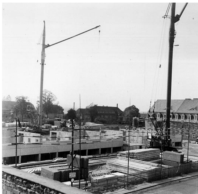
Bau der POS, 1971/72 (HMH 14578_C)

Das ursprüngliche Ziel, den Schulneubau bis zum Jubiläum 1972 abzuschließen, konnte nicht erreicht werden. Und so wurde die POS erst zum Beginn des Schuljahres am 1. September 1973 eröffnet.