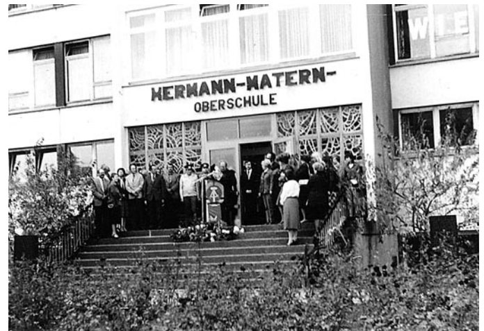
Namensweihe »Hermann Matern Oberschule«, 1983 (HMH 8634)

Am 6. Oktober 1983 erhielt die POS den Namen »Hermann-Matern-Oberschule«. Der Namensgeber Hermann Matern (1893–1971) war in den 1930er Jahren als KPD-Politiker aktiv; in der DDR war er u. a. Mitglied des Politbüros des ZK der SED.