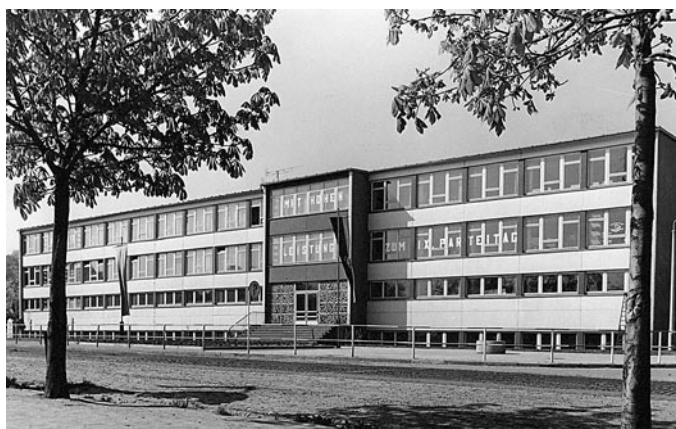
POS mit Losung zum 9. Parteitag der SED, 1979 (HMH 8636)

Der Plattenbau vom Typ »Dresden Atrium« stand offenbar auch ganz bewusst in einem starken stilistischen Gegensatz zur sonstigen eher barocken Architektur des Herrnhuter Stadtzentrums.