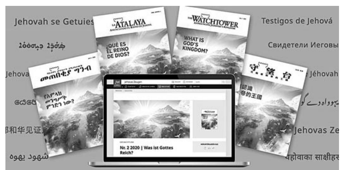
Gedruckte und elektronische Ausgaben des »Wachturms« mit dem Titel »Was ist Gottes Reich« werden im September im Rahmen einer weltweiten Aktion verteilt

Die Zeitschrift kann auf JW.ORG gratis in über 780 Sprachen heruntergeladen werden. Alternativ kann man eine gedruckte Ausgabe bei einem Zeugen Jehovas vor Ort erhalten.