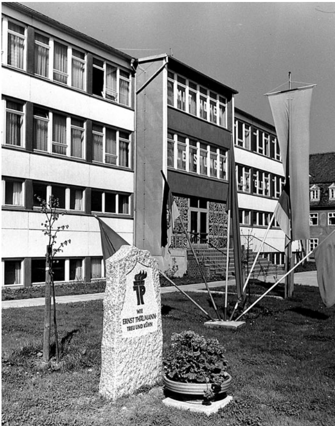
Thälmann-Stein (Junge Pioniere), 1979 (HMH 8635)

Aufgrund der gestiegenen Ansprüche an den Schulsport, aber auch wegen der unpraktisch weiten Entfernung zur Turnhalle an der Goethestraße machte sich sechs Jahre nach dem Bau der POS 1979 der Neubau einer Turnhalle direkt hinter der Schule erforderlich.