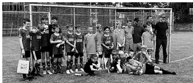
D-Junioren HSV (blau) und Suchdol (hellblau)

Am Samstag standen dann die sportlichen Leckerbissen auf dem Plan. Unmittelbar nach dem Frühstück gingen die D-Junioren um 11.00 Uhr in die Partie gegen Suchdol. Bevor das Spiel angepfiffen wurde, wurden die mitgebrachten Gastgeschenke verteilt. Die Partie war anfangs hart umkämpft, die Herrnhuter Mannschaft vom mitgereisten Trainer Sven Zimmermann setzte sich aber letztendlich mit 4:0 durch. Danke an dieser Stelle an die zwei Suchdoler Leihspieler!