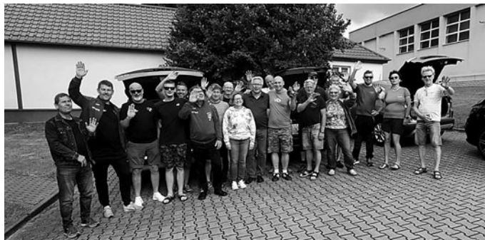
Die Herrnhuter Delegation verabschiedet sich

Am Sonntag hieß es dann für alle mit weinendem Auge wieder: Taschen packen, Fahrzeuge beladen und die Abreise nach Hause antreten. Jedoch lässt der nächste Besuch gar nicht lange auf sich warten, denn schon nächstes Jahr dürfen wir eine Delegation aus Suchdol zum 70-jährigen Jubiläum des Herrnhuter Sportvereins in Herrnhut begrüßen und übernächstes Jahr feiert Suchdol 80-jähriges Bestehen. Wir freuen uns schon sehr darauf!