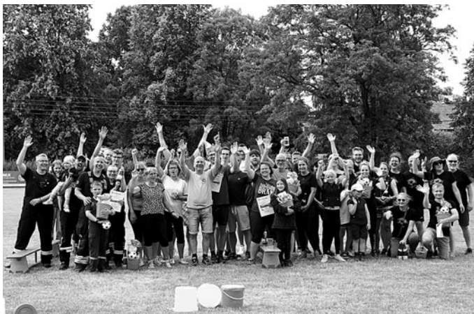
Die Teilnehmer der Gaudimaxxwettkämpfe zur Siegerehrung

Nochmal alles Gute für 120 Jahre TSV – bis bald und viele Grüße vom Großhennersdorfer Karnevalsclub.