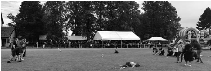
Flunkyball HSV gegen Suchdol

Am Abend stand dann das gesellige Beisammensein mit einer reichhaltigen Verpflegung vom Schwein bis zur Makrele auf dem Plan. Nach dem Abendessen ging der »sportliche« Vergleich in eine zweite Runde. »Flaschenschießen« (im Tor hängende Flaschen mit einem Schuss aus 5,5 Metern treffen), bei dem unser Präsident und Vizepräsident brillierten, sowie Flunkyball regten von Spiel zu Spiel immer mehr interessierte Mitspieler von Jung bis Alt an. Als die Dunkelheit Einzug hielt, verlagerte sich das Geschehen endgültig vom Sportplatz in das Festzelt zum DJ, wo man noch einige Stunden zusammen feierte.