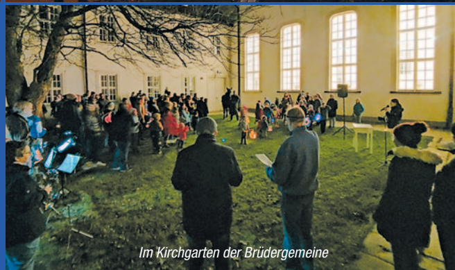
Im Kirchgarten der Brüdergemeine

Viele Lichter brennen heut, geben unserm Herzen Freud. Zündet die Laternen an, Martin ist ein guter Mann.