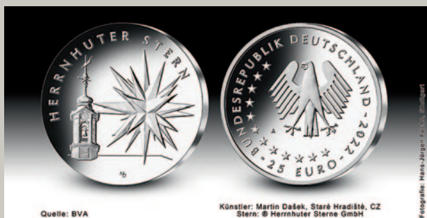
Die 25-Euro-Sammlermünze 2022 »Weihnachten – Herrnhuter Stern« der Bundesregierung; Quelle: BVA, Künstler: Martin Dašek, Staré Hradiště, CZ, Stern: Herrnhuter Sterne GmbH, Foto: Hans-Jürgen Fuchs, Stuttgart

Z um Ausklang der Jubiläumsfeierlichkeiten in diesem Jahr erfährt der Herrnhuter Stern eine herausragende Würdigung: Am 24. November 2022 erscheint mit seinem Motiv und Schriftzug eine staatliche 25-Euro-Silbermünze. Dieses Sammlerstück wird von der Bundesregierung in der Serie »Weihnachten« herausgegeben. Es hat einen Durchmesser von 30 Millimetern, wiegt 22 Gramm und wird als Tellermünze in zwei Prägequalitäten produziert: Stempelglanz und polierte Platte. Durch die Tellerprägung wirkt das Motiv ganz besonders plastisch.