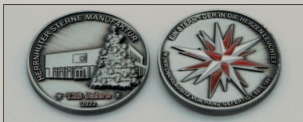
Die Jubiläumsmedaille »125 Jahre Herrnhuter Sterne Manufaktur« der Herrnhuter Sterne GmbH ist ab sofort in der Schauwerkstatt, dem Stammhaus und der Comenius-Buchhandlung erhältlich.

Sie wird zunächst in einer Stückzahl von 500 Exemplaren aufgelegt und wurde bereits unter Kennern in ganz Deutschland für ihr gelungenes Design gelobt. Als prägnantes Motiv ist dabei das moderne Herrnhuter Manufakturegebäude mit einem traditionellen Weihnachtsbaum abgebildet. Die andere Medallenseite ziert ein geprägter Herrnhuter Stern in den Ursprungsfarben Weiß-Rot. Diese kleine Rarität ist in der Schauwerkstatt und dem Stammhaus erhältlich sowie in der Comenius-Buchhandlung, die seit vergangenem Jahr zur Herrnhuter Sterne GmbH gehört.