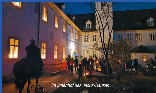
Im Innenhof des Jesus-Hauses