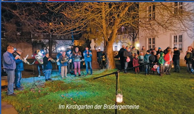
Im Kirchgarten der Brüdergemeine