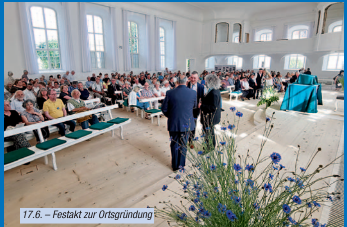
17.6. – Festakt zur Ortsgründung