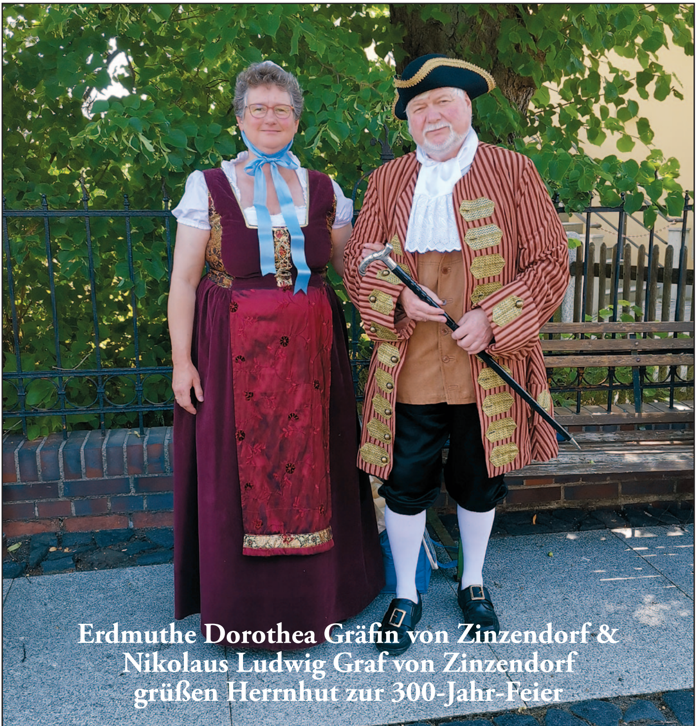
Erdmuthe Dorothea Gräfin von Zinzendorf & Nikolaus Ludwig Graf von Zinzendorf grüßen Herrnhut zur 300-Jahr-Feier

Amtsblatt der Stadt Herrnhut für Berthelsdorf, Großhennersdorf, Herrnhut, Rennersdorf, Ruppersdorf und Strahwalde