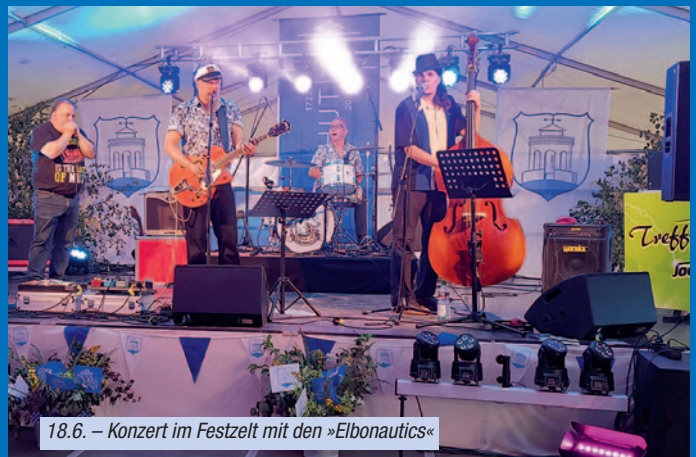
18.6. – Konzert im Festzelt mit den »Elbonautics«