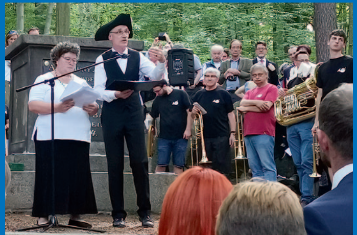
Der Hut passt doch sehr gut!

Aus Zeitgründen wanderte die zur diesjährigen Jahrfeier angekommene Gruppe nur ein kurzes Stück bis nach Herrnhut.