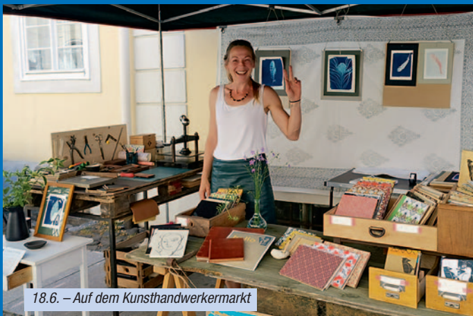
18.6. – Auf dem Kunsthandwerkermarkt