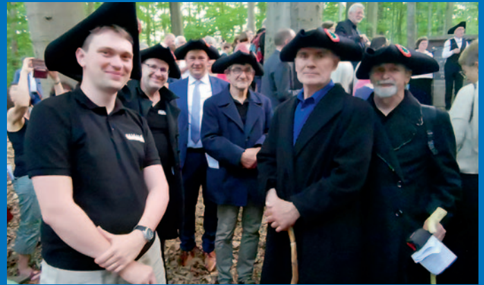
Die Gäste aus Suchdol schenkten dem Bürgermeister einen Hut

Die Strecke von Suchdol bis Herrnhut ist die Strecke der mährischen Exulanten, hier entlang flohen die protestantischen Glaubensflüchtlinge 1724 erstmals bis Herrnhut, sie ist etwa 350 Kilometer lang. In Zauchtel wurde 1604–1614 eines der größten Gemeindehäuser der Evangelischen errichtet. Zauchtel entwickelte sich zu einem Zentrum der Protestanten. Anfang des 17. Jahrhunderts begann hier aber wieder eine Rekatholisierung. Die Böhmisches Brüder setzten ihre Zusammenkünfte im Untergrund fort, bis sie 1724 nach Herrnhut auswanderten. Es sollen damals aus Zauchtel und Umgebung etwa 550 Einwohner geflohen sein.