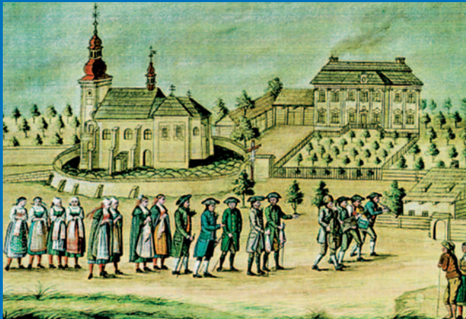
Prozession einer Bauernhochzeit in der damals üblichen Tracht des 17. Jh. vor der Patschendorfer Kirche und Pfarrei (aus: »Über die Kuhländer Trachten«, herausgegeben vom »Alte Heimat, Verein heimattreuer Kuhländer e. V.«, Wiesenbach, nach 1972)