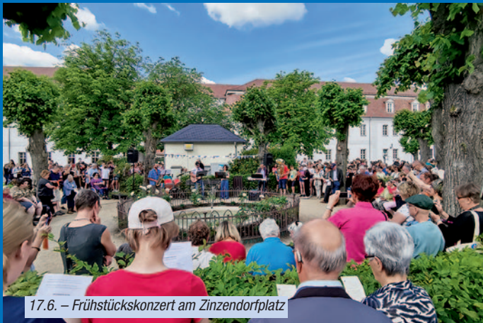
17.6. – Frühstückskonzert am Zinzendorfplatz