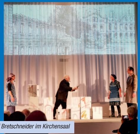
16.6. – Tosenen Beifall gab es für das Theaterfestspiel »100 Jahre Herrnhut« von Olaf Bretschneider im Kirchensaal