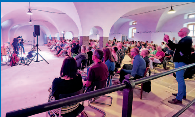
12.6. – Phantastisches Jazz-Konzert im Zinzendorf-Schloss