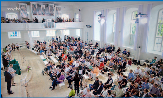
12.6. – Eröffnungsgottesdienst – live im MDR