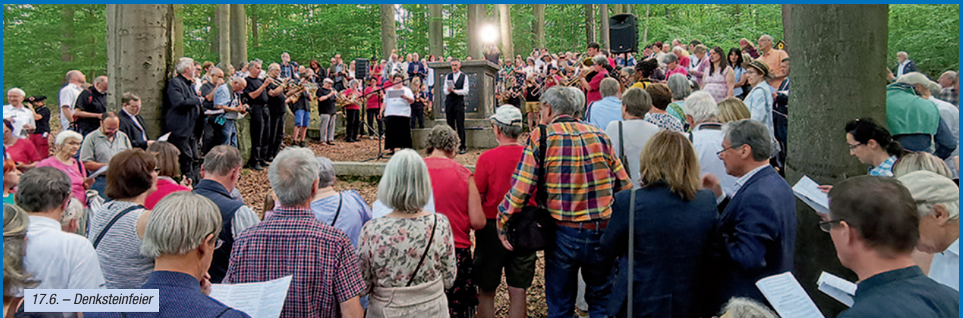
17.6. – Denksteinefeier