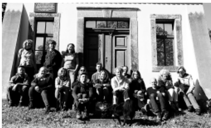
Gruppenfoto der Teilnehmer »Vergessene Orte« 2022

Wanderstart. Wer möchte, kann auch direkt zum Startpunkt kommen. 13.30 Uhr startet die Wanderung am Waldeingang »Batzenhütte« am Königsholz.