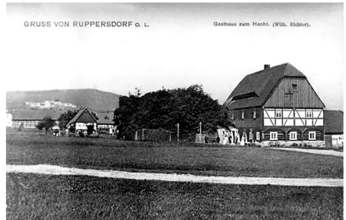
Ansichtskarte von Ruppersdorf mit der Schänke zum Hecht, um 1910