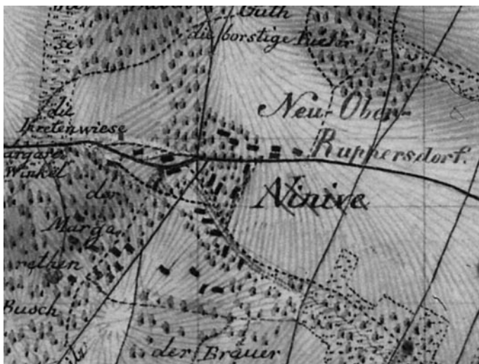
Kartenauszug mit dem neuen Anbau von Neu-Ober-Ruppersdorf um 1805

türlich durch ihre etwas abseitige und dem Argwohn des Pfarrers entrückte Lage für derartige Lustbarkeiten etwas besser geeignet als die unmittelbar im Ort gelegenen Schänken. Das bleibt jedoch nur eine sympathische Mutmaßung.