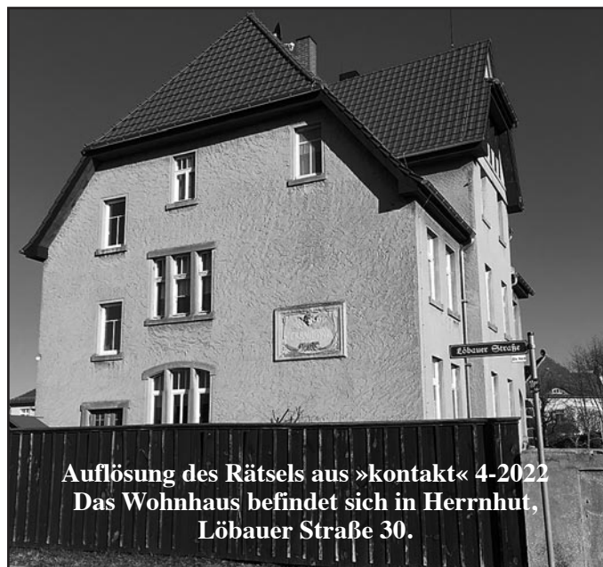
Auflösung des Rätsels aus »kontakt« 4-2022 Das Wohnhaus befindet sich in Herrnhut, Löbauer Straße 30.

Meilenblatt (Freiberger Exemplar) Blatt 371: Herrnhut, Grundaufnahme um 1805