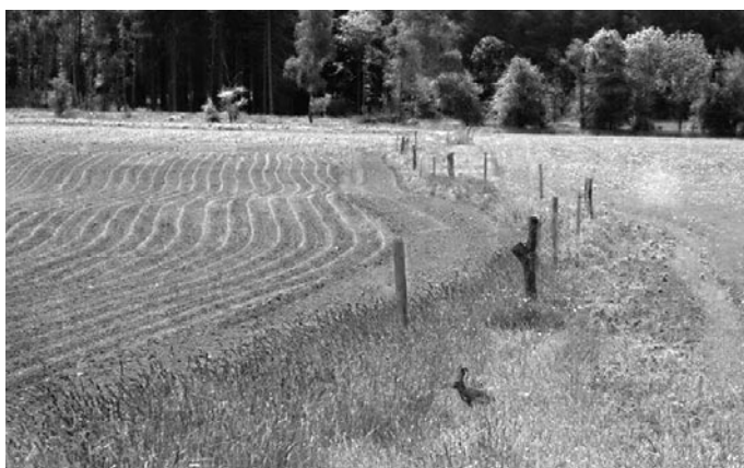
Feldhase · Foto: R. Heinrich

Die Wiesen, von denen Mahdgut für den Feldrain gewonnen wurde, liegen rund um Ebersbach-Neugersdorf. Es handelte sich u.a. um bunte Wiesen der Ev.-Luth. Kirchengemeinschaft Obercunnersdorf, die ihre Wiesen an der Kirche und am Friedhof in Kottmarsdorf zur Verfügung stellte, sowie um Wiesen von Privateigentümern. Für das Mahdgut möchte sich der NABU nochmal recht herzlich bedanken. Denn ohne diese Unterstützung wäre die Umsetzung des Projektes nicht möglich gewesen. Abgeschlossen ist das Projekt aber noch nicht, denn damit die Wiesenkräuter sich langfristig auf dem Feldrain etablieren können, muss die Fläche in den Folgejahren stetig weiterentwickelt werden. Dies geschieht unter anderem mittels Schröpfschnitt. Bei einem Schröpfschnitt wird die aufkommende Vegetation ab einer Bestandshöhe von 10 bis 20 cm in einer Höhe von ca. 8 cm geschnitten. Damit werden unerwünschte Ackerbeikräuter und Ruderalarten zurückgedrängt, die ansonsten mit den Wiesenkräutern um Licht, Nährstoffe und Wasser konkurrieren würden. Je nach Wüchsigkeit der Vegetation ist der Schröpfschnitt dabei ein- bis zweimal im Jahr durchzuführen.