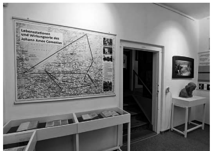
Blick in die neue Sonderausstellung

Die Ausstellung ist bis zum 31.10.2021 zu den Öffnungszeiten zu sehen. Konrad Fischer, Heimatmuseum der Stadt Herrnhut