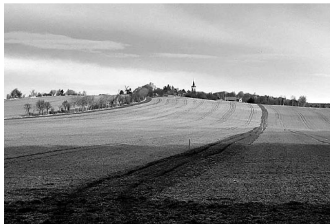
Standort Feldrain Kottmarsdorf

die im Mahdgut enthaltenen Samen nachreifen und auf dem Saatbeet ausfallen. Die im Mahdgut enthaltenen Pflanzenreste, wie Blätter und Stängel, schützen die Samen dabei vor Austrocknung und ermöglichen so ein ungestörtes Keimen.