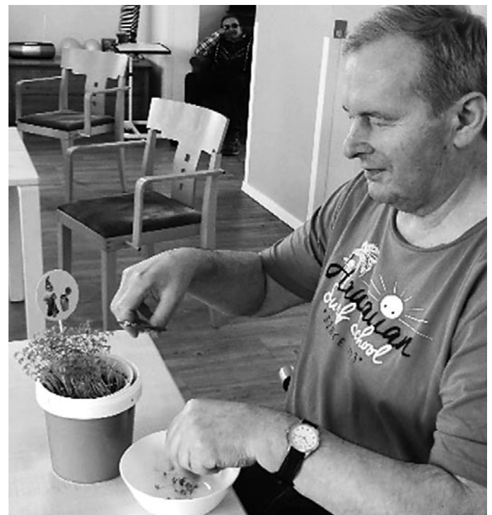
Beim Ernten der Kresse

In den vergangenen Tagen streuten wir in kleine Blumentöpfe Kressesamen und erfreuten uns gemeinsam am schnellen Wachstum der zarten Pflänzchen. Zum leckeren selbstgemachten Quark mit frischen Kräutern passte unsere Kresse hervorragend. Auch auf ein Butterbrot schmeckte sie uns sehr gut. Die Gartenkresse hatte einen leicht scharfen Geschmack und erinnerte uns an Senf und Rettich.