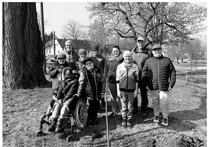
Einige der jungen Gärtnerinnen und Gärtner mit Lehrkräften und Betreuern

Die Pflanzung fand bereits am 26. März statt. Sie war zu diesem frühen Zeitpunkt nötig aufgrund der besonderen Beschaffenheit der Bäume.