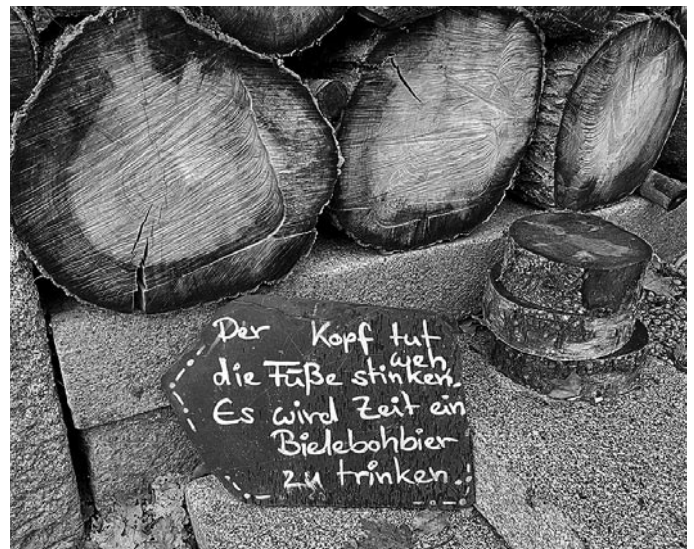
Wenn das nicht zum Verweilen einlädt!

Der Weg zum Bieleboh ist deutlich kürzer. Man kann in Beiersdorf bis zum Bieleboh-Parkplatz kurz vor dem Waldrand fahren und ist im Nu am Aussichtsturm. Der ursprünglich 12 Meter hohe Turm wurde am 6. Mai 1883 eingeweiht. Da er am 2. Juli 1910 durch Blitzschlag ausbrannte, wurde noch im gleichen Jahr dieser Turm erneuert und vier Meter höher gebaut, so dass er bereits im September des gleichen Jahres (!) wieder eingeweiht werden konnte. Bei der Instandsetzung im Jahr 1998 wurde der Bielebohturm um weitere fünf Meter erhöht, so dass wir heute auf einen 21 Meter hohen Turm steigen können.