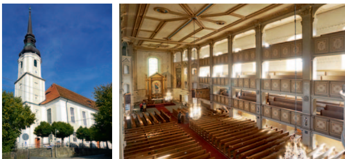
Die Cunewalder Dorfkirche