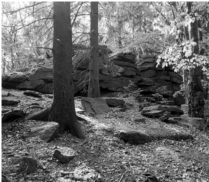
Gipfelklunsen auf dem Corneboh

»... Czorneboh: ein halbtägiger Ausflug ... von allen Bautzner Bergen am meisten besucht. Er gehört zu den Ausläufern des Riesen resp. Isergebirges, seine Höhe 1717 Fuss über dem Meere. Besuchte Restauration mit Veranda, Gesellschaftsplatz etc. Der schöne Aussichtsturm (Entrée 10 Pf.) wurde 1851 erbaut, er ist 80 Fuss hoch, 91 Stufen führen zur Plattform, die eine großartige Rundschau gestattet.«