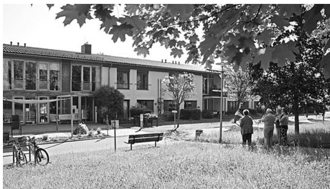
Bläser vor dem Anna-Nitschmann-Haus

Neben verschiedenen Betreuungsangeboten ist seit einigen Jahren ein Garten der Sinne am Anna-Nitschmann-Haus neu hinzugekommen. Er wurde angelegt, um auch demenziell erkrankten Menschen in einem geschützten Rahmen Naturerfahrungen und den individuellen Aufenthalt im Freien zu ermöglichen. Viele hatten früher selbst einen Garten und freuen sich, hier Blumen und Nutzpflanzen pflegen und genießen zu können.