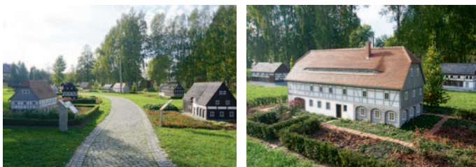
Der Umgebendehaus-Park in Cunewalde