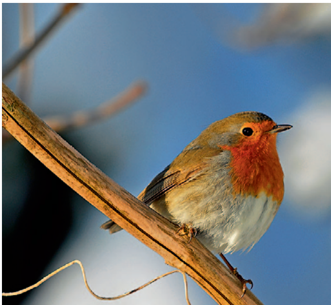
So sehen Sieger aus: Das Rotkehlchen ist der erste öffentlich gewählte »Vogel des Jahres«

fast überall in Wäldern, Parks und Siedlungen zu Hause. Er hat im Wahlkampf mit dem Slogan »Mehr Gartenvielfalt« für sich und vogelfreundliche Gärten geworben.«