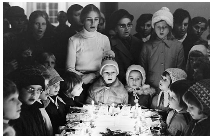
1974: Kindergartenweihnachtsfeier in Herrnhut