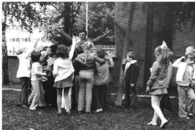
ca. 1978: Kinder spielen im Kirchengarten