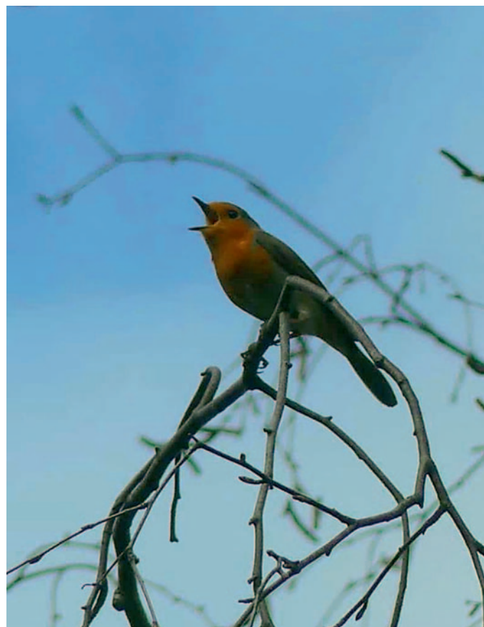
Rotkehlchen · Foto: B. Böhme

Ebersbach-Neugersdorf – Vom 13. bis 16. Mai 2021 startet der Naturschutzbund Deutschland (NABU) in die 17. »Stunde der Gartenvögel«. An diesem Wochenende sind alle Naturfreunde/-innen aufgerufen, eine Stunde lang im Siedlungsraum Vögel zu beobachten, zu zählen und dem NABU zu melden.