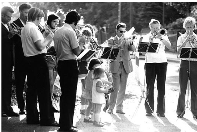
8.8.1975: Posaunenchor auf der Rennersdorfer Straße