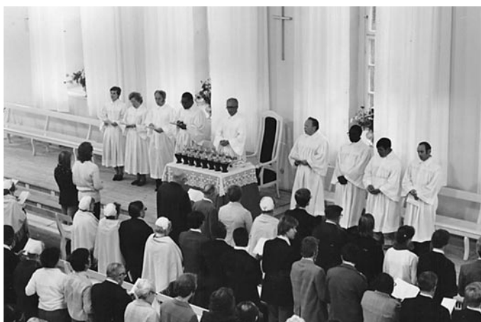
1982: Abendmahl bei der Generalsynodedde wird fortgesetzt