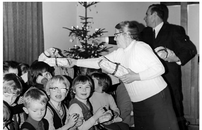
1974: Weihnachtsgaben in der evangelischen Freikirche Berthelsdorf