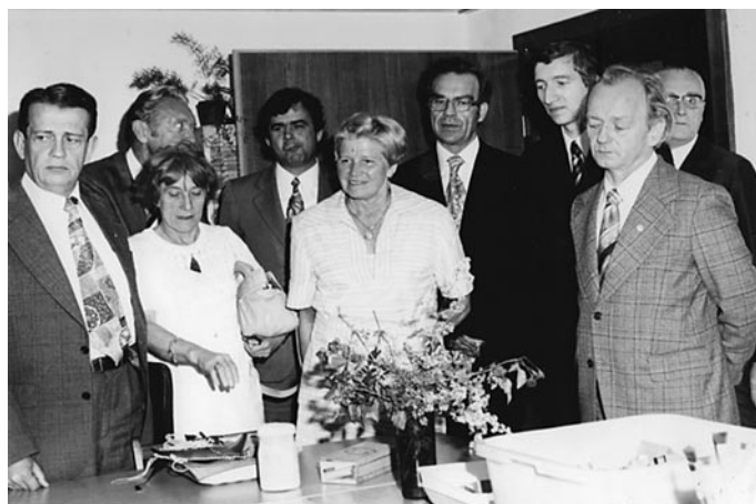
17.7.1977: Einweihung FÖZ