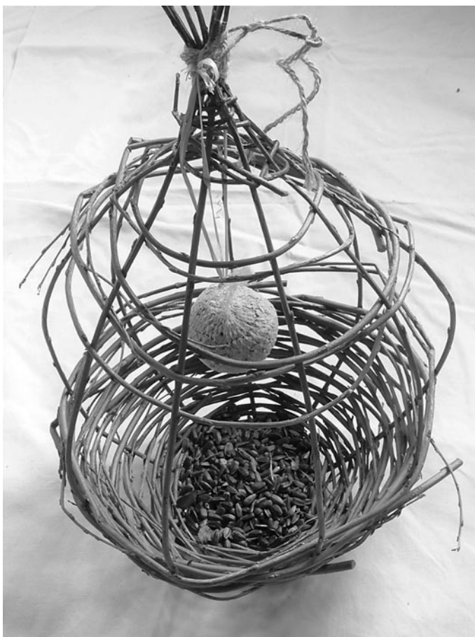
Weidenei der Kita Knirpsenland Oderwitz

Ebersbach-Neugersdorf – Wir bedanken uns bei allen Kindern, die an unserer kunterbunten Osterbastelei teilgenommen haben für die schönen Ostereier. Sei es das Weiden-Ei als Ostergeschenk für die Vogelwelt oder das mit Kurkuma sonnengelb eingefärbte Osterei für den Handstrauß, mit eurer Kreativität und eurem Einfallsreichtum ist es euch gelungen, wahre Kunstwerke zu erschaffen.