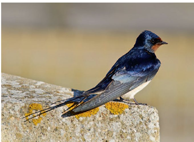
Platz 2 machte die Rauchschwalbe

Medieninfoseite zur Vogelwahl mit Bild-, Audio- und Filmmaterial sowie Radio-O-Töne: www.NABU.de/medieninfos-vogelwahl