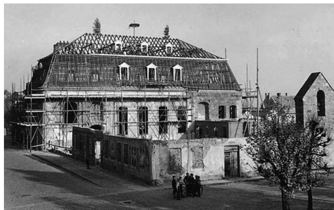
30.10.1951: Richtfest Kirchensaal Herrnhut