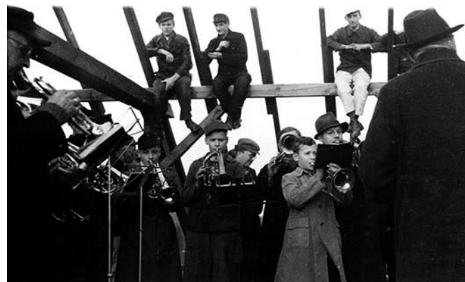
ca. 1950: Richtfest Kirche in Herrnhut