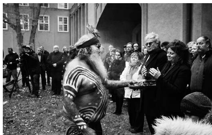
Rückgabe menschlicher Gebeine nach Australien am 28. November 2019 GRASSI Museum für Völkerkunde zu Leipzig

Die Völkerkundemuseen in Leipzig, Dresden und Herrnhut, die seit 2010 Teil der Staatlichen Kunstsammlungen Dresden sind, beschäftigen sich seit Jahren mit der Aufarbeitung der eigenen kolonialen Vergangenheit. Dekolonisierung richtet sich gegen koloniale Diskriminierungsstrukturen, sowohl körperlich spürbare als auch jene, die unsere Denkweisen beeinflussen. Sie ist demnach ein aktiver Prozess, der allen offensteht. Die neue Plattform auf der Webseite www.skdmuseum.de/dekolonisierung lädt zum Dialog ein und schafft mehr Transparenz in diesem ethnologischen Diskurs. Im ersten Abschnitt »Aktuelle Projekte« finden sich Hintergründe zu abgeschlossenen und laufenden Projekten der drei Museen mit internationalen Kollaborationspartner*innen und -gruppen. Unter der Rubrik »Anfragen« können sich Besucher*innen der Webseite über den Ablauf von Restitutions- und Repatriierungsanfragen zu Sammlungsbeständen und Vorfahren (menschliche