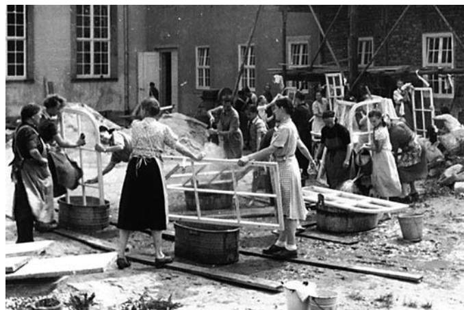
Anfang der 1950er Jahre: Vor der Einweihung des Kirchensaals Herrnhut beim Fensterputz, Foto: Tilmann Verbeek

Fotos der Ausstellung »kirchliches Leben in der DDR« – eine Ausstellung in Zusammenarbeit mit der Johann-Amos-Comenius-Schule Herrnhut und der Netzwerkstatt der Hillerschen Villa – Teil 1