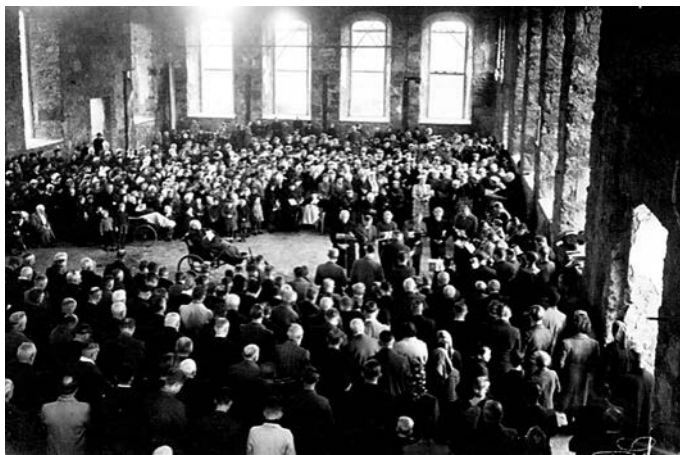
30.10.1951: Richtfest Kirchensaal