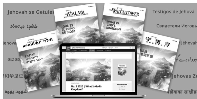
Gedruckte und elektronische Ausgaben des Wachturms mit dem Titel »Was ist Gottes Reich« werden im November im Rahmen einer weltweiten Aktion verteilt

Eine elektronische Ausgabe ist auf der offiziellen Website von Jehovas Zeugen (jw.org) in Hunderten von Sprachen verfügbar (unter Bibliothek > Zeitschriften).