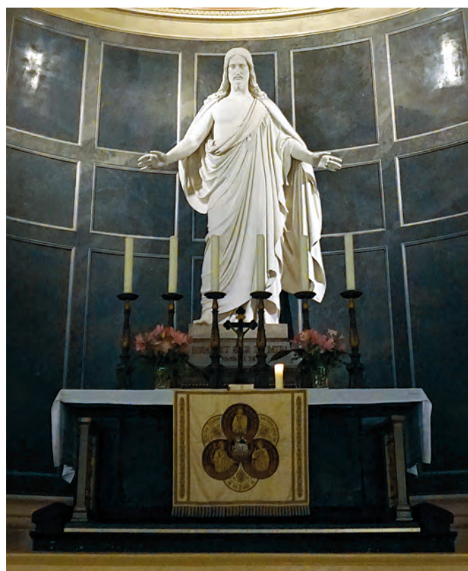
Kopie der Christusstatue von Thorvaldsen in St. Johannis, Zittau

ne Figur mit erhobenen Händen, den segnenden Christus. Thorvaldsen wollte aber einen »neuen« Christus schaffen, einen, der ein Freund der Zöllner und der Sünder sei, so entschied er sich für einen mit halb ausgebreiteten nach unten gewandten Armen, so wie wir eine Kopie des Originals in der St.-Johannis-Kirche in Zittau finden.