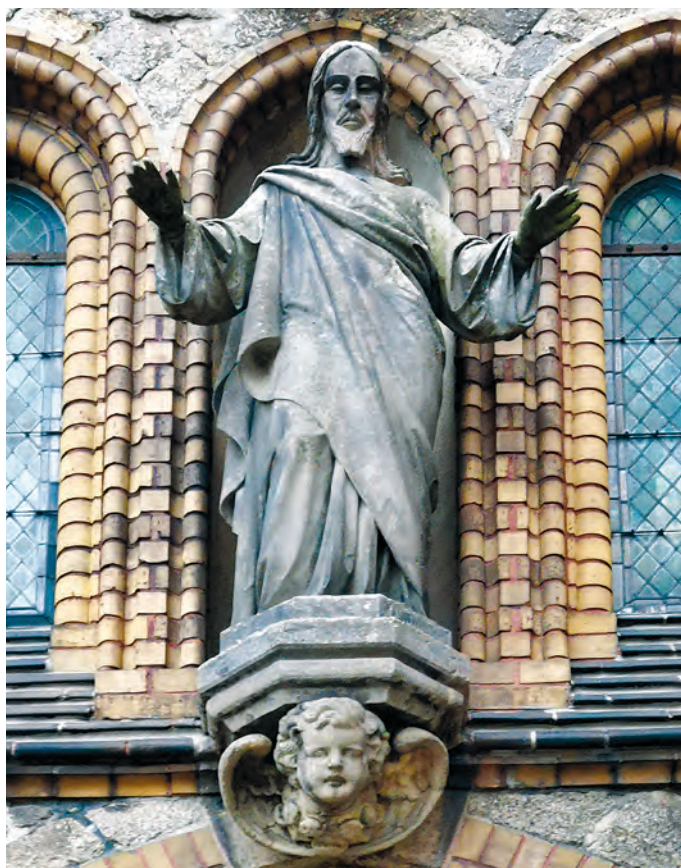
Christusstatue über dem Eingangsportal der Strahwalder Kirche

Zum Titelbild: Der dänische Bildhauer und Medailleur Bertel Thorvaldsen wurde vor 250 Jahren geboren