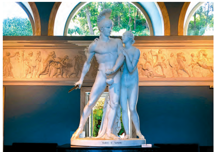
Der Alexanderfries in der Villa Charlotta in Tremezzo

Der inzwischen in ganz Europa bekannte Bertel Thorvaldsen zählt nun zu den bedeutendsten Denkmalplastikern der ersten Hälfte des 19. Jahrhunderts. Er bekam Aufträge von klerikaler, wie von monarchischer, aber auch demokratisch-bürgerlicher Seite.