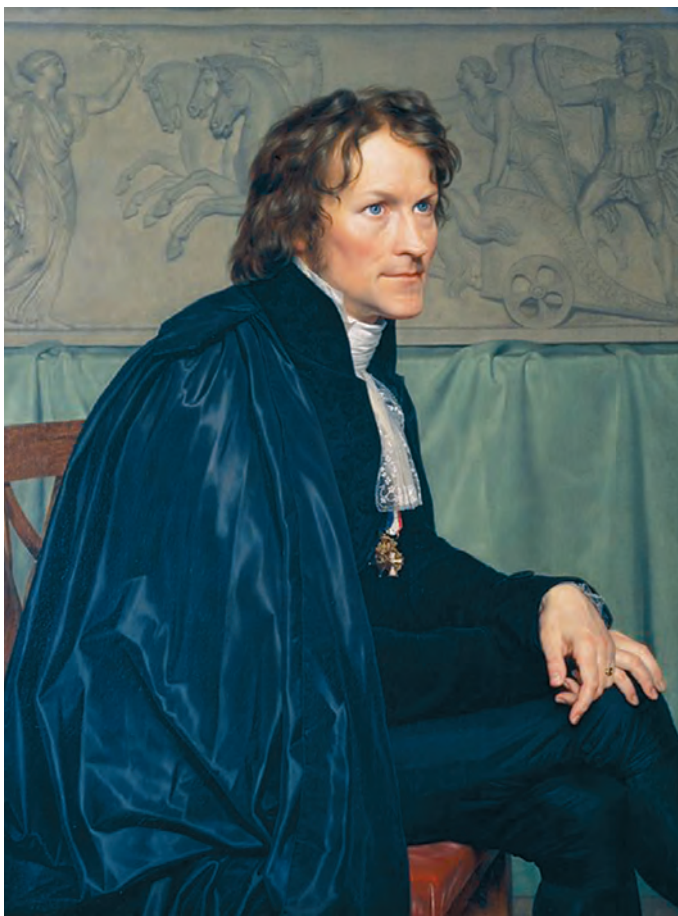
Christoffer Wilhelm Eckersberg: Thorvaldsen vor dem Alexanderfries, 1838

Nachdem er 1793 die große Goldmedaille der Akademie gewann, war seine Akademiezeit beendet, er musste nun von seiner Kunst leben. In der Regel gab es nach der Akademie ein Stipendium für einen dreijährigen Auslandsaufenthalt, aber auch in der Regel musste man mehrere Jahre darauf warten. Bis zu seiner Abreise nach Rom im Jahre 1796 war Thorvaldsen viel mit Portraitaufträgen beschäftigt, auch einige Büsten entstanden in dieser Zeit. Thorvaldsen führte ein flottes Leben mit seine Freunden. Er selbst spielte Violine und Flöte und unterhielt andere mit seiner musikalischen Begabung. Nach Aussagen von Zeitgenossen sah er gut aus und war damit bei den Mädchen »gern gesehen«.