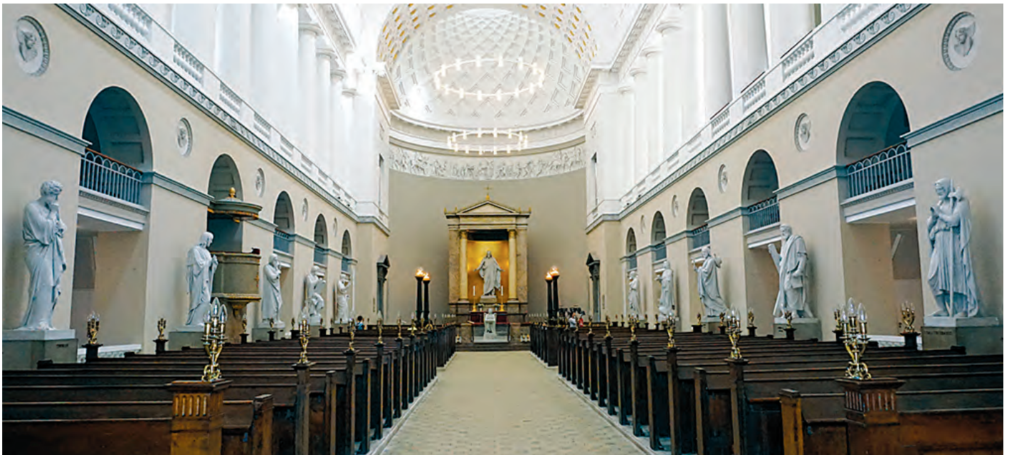
Die Kathedrale »Unserer Lieben Frau« in Kopenhagen mit der Innenausstattung von Thorvaldsen