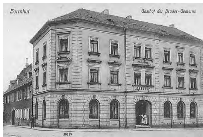
neuer Gasthof nach dem Umbau 1895 (Inv. HMH 8986)

145 Jahre später besuchte der Sächsische König Friedrich August III. am 27./28. Juli 1911 Herrnhut. Auch für diesen Besuch wurde entsprechender Aufwand betrieben. So wurden vier aufwändige Ehrenportalen von Architekten entworfen und der Schmuck von Saal und Chorghäusern einem Dekorationsgärtner übertragen. Nach seinem Tagesprogramm mit Empfang, Besuch des Hutberges und des Ethnografischen Museums war im Gasthof, wo der König auch übernachtete, eine Festtafel für 27 Gäste hergerichtet.