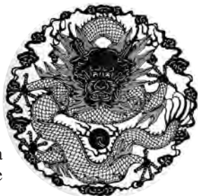
Foto: Scherenschnitt, China

Nur begrenzte Besucherzahl möglich – um Anmeldung wird gebeten.