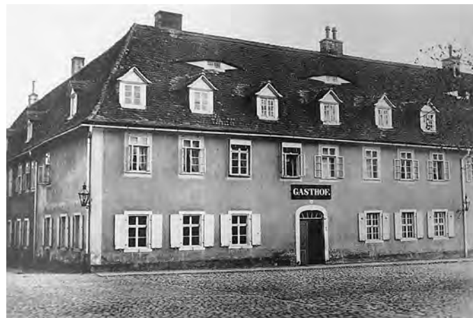
alter Gasthof vor dem Umbau 1895 (Inv. HMH 5278)

Bewirtung von fremden Geschwistern oder Freunden oder solcher Personen, die hier Verrichtungen oder die Absicht haben, die Gemeinde kennenzulernen.