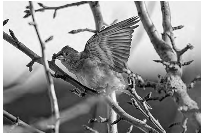
Buchfink, Foto: Gerd Goldberg

des Löbau präsentiert. Also Stift geschnappt, Fernglas bereit und los geht's.