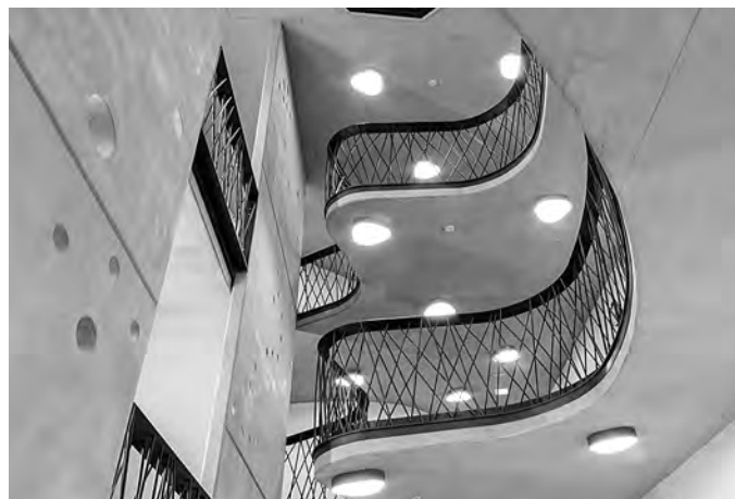
Fotos des Gebäudes, Bildrechte liegen bei Stephanie Rudolph ( https://www.li-d.de/liarde/ )

Der Neubau besticht durch seine hochwertige klassische Formgebung, die sich an Details wie z.B. gegliederten Fenstern, spitzen Dachgauben, Fensterumrahmungen und horizontaler Fassadengliederung erkennen lässt. Trotz der Verwendung überwiegend traditioneller Materialien wie Ziegel, Lehmziegel oder Holz, erfüllt das Gebäude dennoch die Erfordernisse niedrigen Energieverbrauchs und des Brandschutzes und ist innen modern nach den Erfordernissen eines zeitgemäßen Schulbetriebs gestaltet.