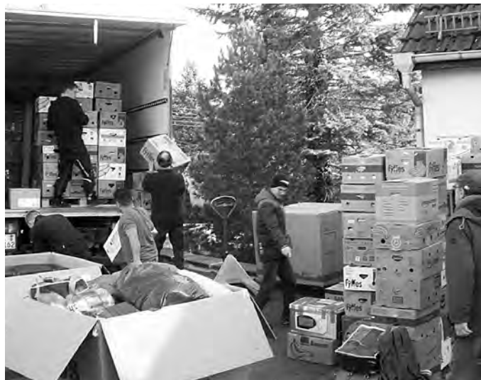
Der Lkw vom Missionswerk FriedensBote wird beladen ...

Der größte Teil der Hilfsgüter für die Ukraine hat vor ein paar Tagen das Bibelheim verlassen. Diesmal erhielten wir so viele Spenden, dass der Lkw ein zweites Mal kommen muss, um alles abzuholen, und wir kapazitäts- sowie kräftemäßig ziemlich gefordert waren. Über 400 Kisten mit Textilien und fast 100 Säcke mit Schuhen, Decken und Plüschtieren konnten wir füllen. Dazu viele Taschen, Koffer, Rucksäcke mit Kosmetikartikeln und Schreibwaren. Außerdem wurden jede Menge Fahrräder, Kinderwagen, Matratzen und vieles mehr abgegeben.