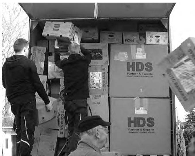
... und ist viel zu schnell restlos gefüllt.

Vor allem aber danken wir unserem Gott und Vater im Himmel, der diese Bereitschaft zum Geben in so viele Herzen gelegt hat. Unser Wunsch ist es, dass die Ärmsten der Armen in der Ukraine durch unsere Gaben die Liebe Gottes kennenlernen. Dann hat sich aller Einsatz gelohnt.