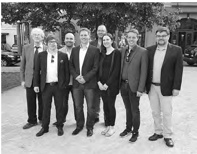
Vorstand des Vereins »Stadtbild Deutschlands« (Bildrechte freigegeben)

In seiner jährlich stattfindenden Mitgliederbefragung hat der Verein Stadtbild Deutschland e.V. aus einer Auswahl herausragender Neubauten ein Gebäude ausgewählt und zum »Gebäude des Jahres« ernannt. Damit möchte der Verein jedes Jahr solche Neubauten auszeichnen, die sich dem klassisch-traditionellen Bauen bzw. dem harmonisch einfügenden Bauen in vorhandenen Baubestand verpflichtet sehen.