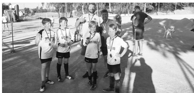
Auch die Fußballer nahmen nach ihrem Spiel erfolgreich am Spendenlauf teil.