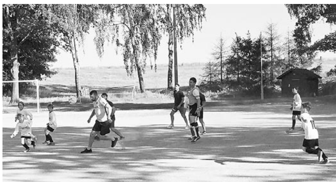
Beim Spiel der Nachwuchsfußballer gegen ihre Eltern ging es voll zur Sache.