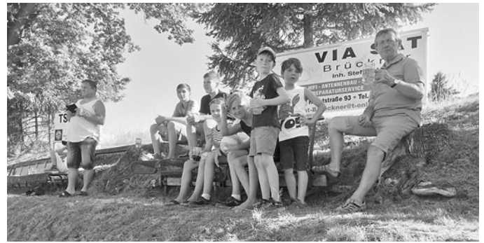
Die Ränge füllen sich vor dem Beginn des Tauziehens.