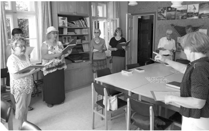
Am Sonntag: Chorprobe vor dem Gottesdienst