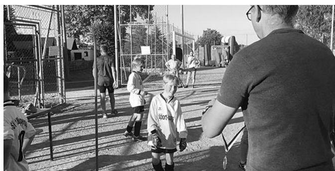
Geschafft ... und als Belohnung gab es eine Medaille.