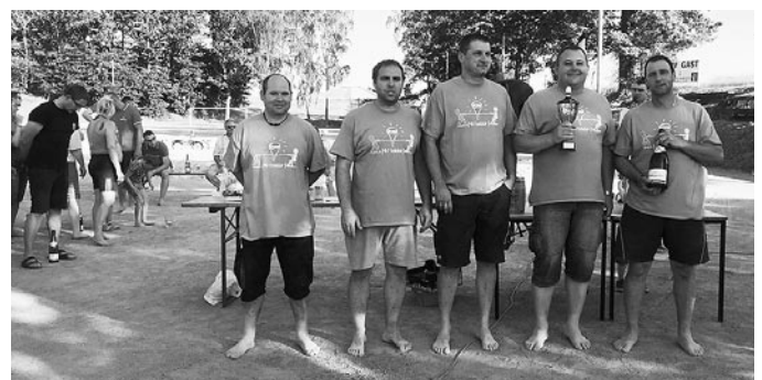
Sieger und Titelverteidiger Tauziehen 2019: das Mitteldorf.