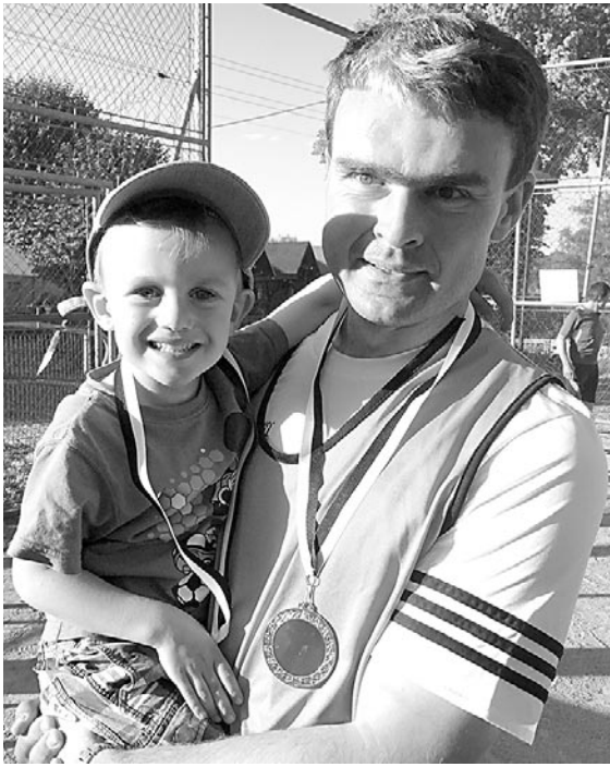
Auch der jüngste Teilnehmer schaffte die Runde.