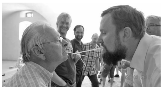
und verschiedene Spielerunden.