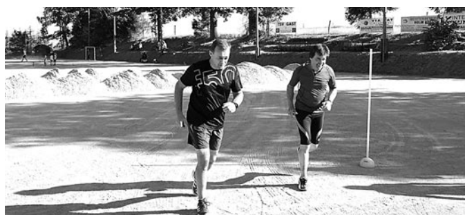
Der Spendenlauf für das Projekt Rasenplatz startete auf dem Sportplatz.

Folgende Bilder ergänzen den Bericht zum Sportfest eindrücklich: