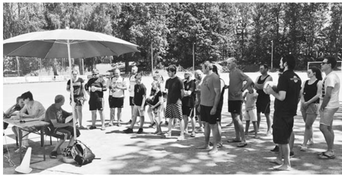
Die Volleyballer unseres Vereins hatten zu einem Beachvolleyballturnier eingeladen.