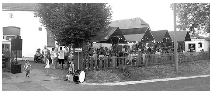
Regel Festbetrieb an der Turnhalle am Sonnabend Abend.