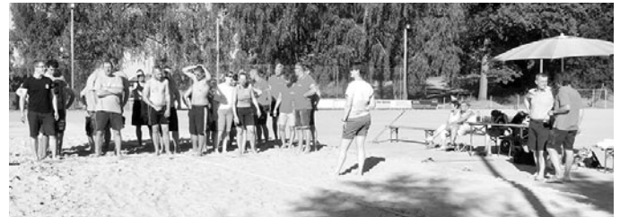
Die Mannschaften des Tauziehens 2019: Kämpfergemeinschaft Ninive, Mitteldorf, Fußball-Männer, Frauen, Niederdorf (v. l. n. r.).