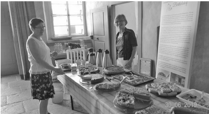
das reichhaltige Kuchenbuffet