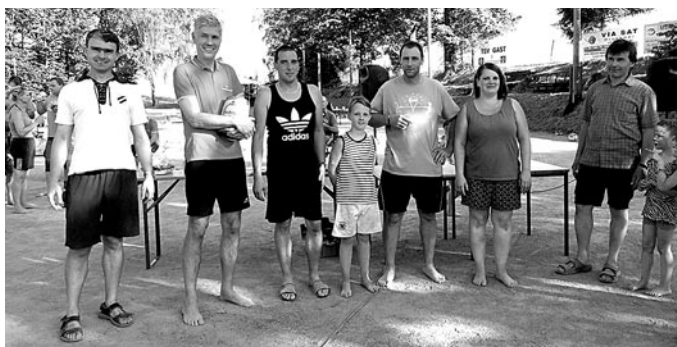
Siegermannschaft des Beachvolleyballturniers 2019: die Volleyballer des TSV 1890 Ruppertsdorf.