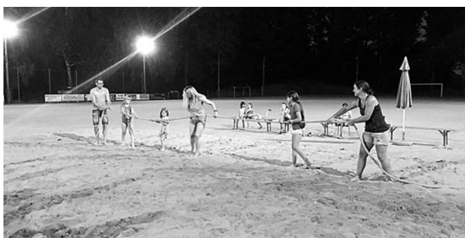
Am späteren Abend fanden noch weitere Tauziehwettbewerbe unter Flutlicht statt.