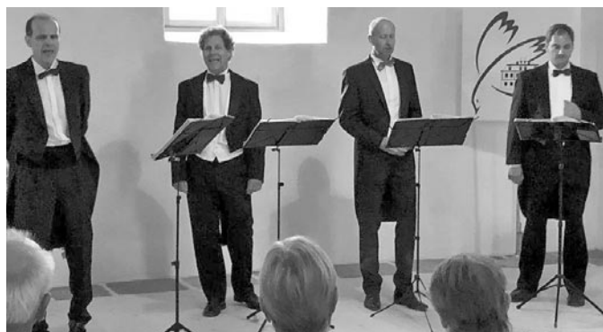
Am Freitag gab es als Auftakt des Gemeindefestes ein Konzert mit den Dresdner Zwinger Singers im Zinzendorf-Schloss.