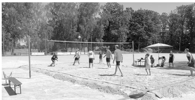
Spielszene vom Spiel der Fußball-Männer (l.) gegen die Volleyballer (r.).