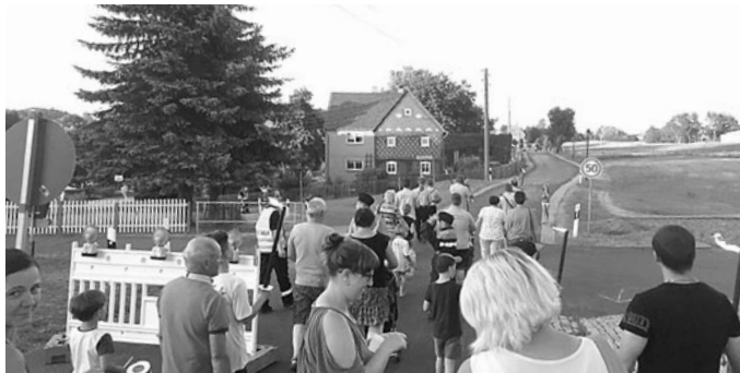
Fackelzug mit dem Spielmannszug Obercunnersdorf.