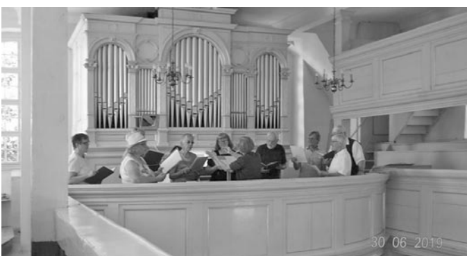
und dem Kirchenchor Berthelsdorf