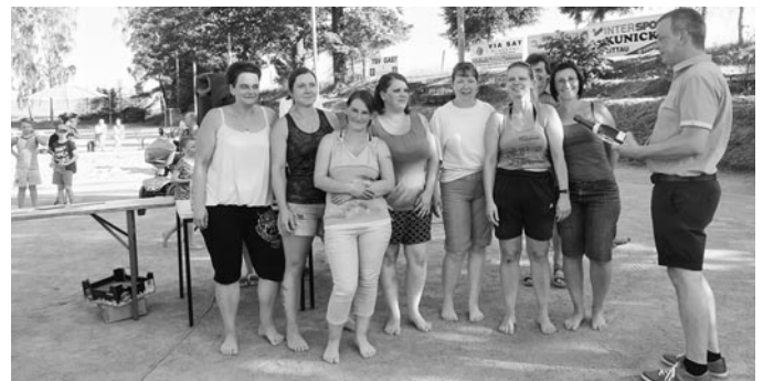
Siegerehrung des Tauziehens: die Frauen wurden nicht Letzter!