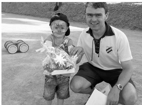
Bei den Familienspielen gab es wieder tolle Preise zu gewinnen, hier z.B. ein Ensemble der Herrnhuter Sterne.