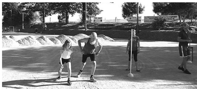
Das Teilnehmerfeld umfasste mehrere Generationen.