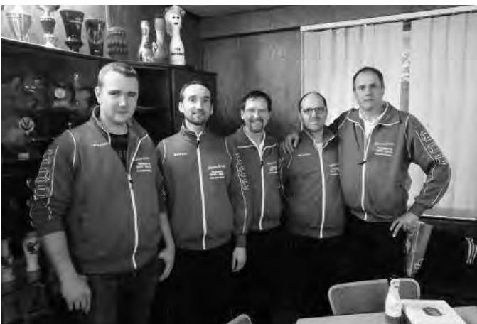
Nach dem Spiel in Lawalde