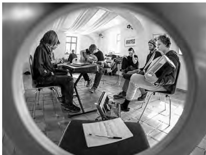
Lanterna futuri

Mi., 10.4.2019, Beginn: 20.00 Uhr Begegnungszentrum