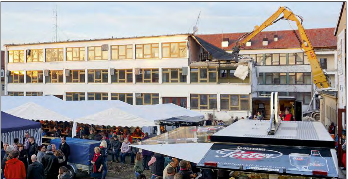
Schulfest am 29. März 2019 – Besichtigung des neuen Schulhauses der Zinzendorf-Schulen in Herrnhut

Amtsblatt der Stadt Herrnhut für Berthelsdorf, Großhennersdorf, Herrnhut, Rennersdorf, Ruppersdorf und Strahwalde