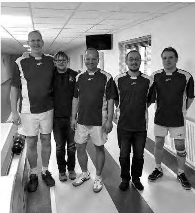
Mannschaft mit größtem Fan von SV Reichenbach

Herzlichen Glückwunsch und weiterhin »Gut Holz!«.