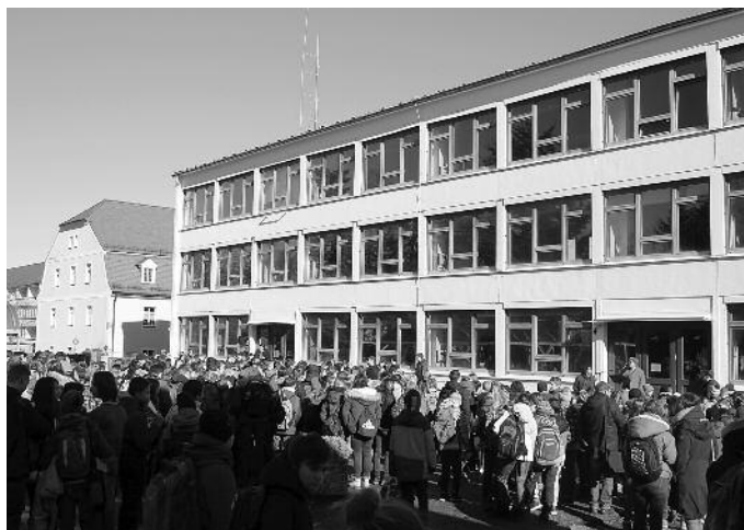
Das alte Schulhaus »TYP Dresden« wird zurückgebaut.

Mit der feierlichen Einweihung des neuen Schulhauses sind nun auch die Tage des alten Schulhauses gezählt, denn der Ausbau des Schulcampus kann nur weitergehen, wenn der Abbruch des alten Gebäudes erfolgt ist.