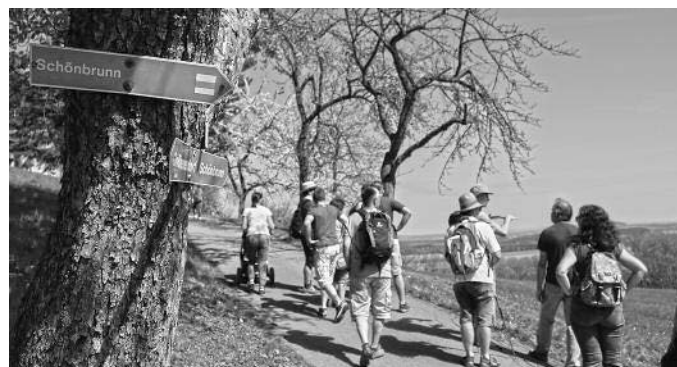
Willkommen auch in diesem Jahr – Frühjahrswanderung 2018