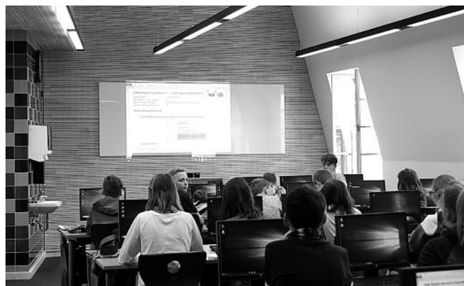
Unterricht in den neuen Räumen – März 2018

Von außen her belebt das neue Schulgebäude nun einen Teil des am 9. Mai 1945 zerstörten Stadtkerns von Herrnhut neu. Die Außenfassade, die im Stil des »Herrnhuter Barock« gehalten wurde, passt sich perfekt in das Stadtbild ein und prägt damit das Ortsbild an sich. Der Umgang mit den vor Ort gegebenen Möglichkeiten und Ressourcen wurde berücksichtigt. Letztendlich ist dies ein starkes Symbol für die lebendige Entwicklung des Ortes Herrnhut, der mitten im Leben steht und trotzdem fest mit seiner Tradition verwurzelt ist.