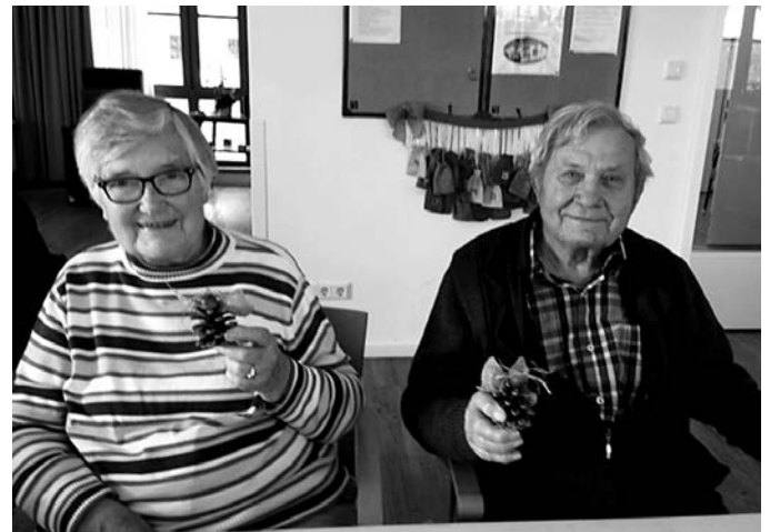
Basteln von Weihnachtsdekoration mit Tagesgästen